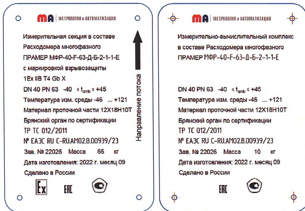
Рисунок 3 – Общий вид маркировочной таблички для ИС и ИВК МФР ПРАМЕР